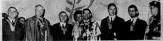
Les nouveaux intronisés