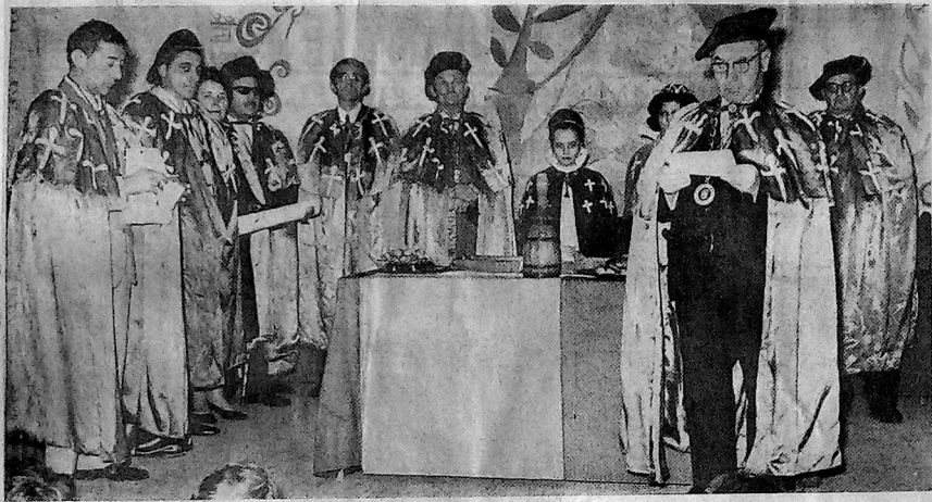
Le grand maître des Compagnons de la Madeleine de Commercy présidait