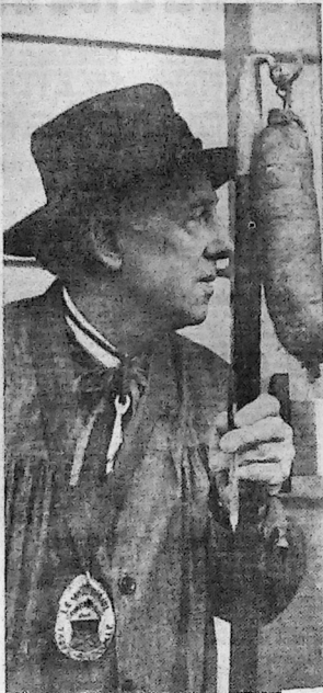
La cérémonie d'intronisation 1972

REMERCIEMENTS. — « Frères humains qui après nous vivrez, le gandoyau ajolais pieusement savourerez », eut dit François Villon, s'il avait pu faire partie de la « docte, insigne et gourmante confrérie des Tasse-Andouille du Val-d'Ajol », qui a tourné, hier, son huitième chapitre.