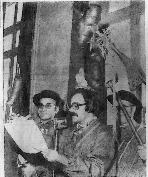
Epinal. — Le troisième lundi, 19 e jour du mois de février de l'An 1973, la Docte, Insigne et Gourmante Confrérie des Tasse-Andouilles du Val-d'Ajol tiendra son Chapitre souverain.

Ce VIII e Chapitre se déroulera dans la tenue, compagnie de Confrères vintoux et gastronomiques qui viendront déguster en amicale société l'andouille délectable à souper du Val-d'Ajol.