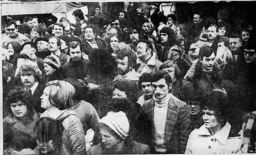
■ La foule des grands jours