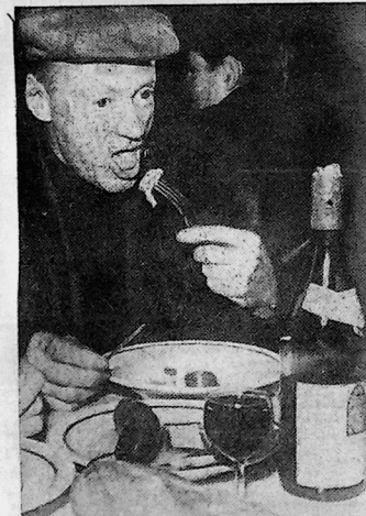
Un dégustateur parmi tant d'autres.