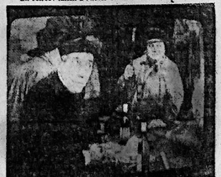
Les tasse-Andouilles et le Ferrandais belge à « La bonne franquette »