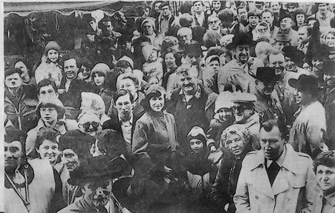
Il y avait foule pour cette manifestation traditionnelle.