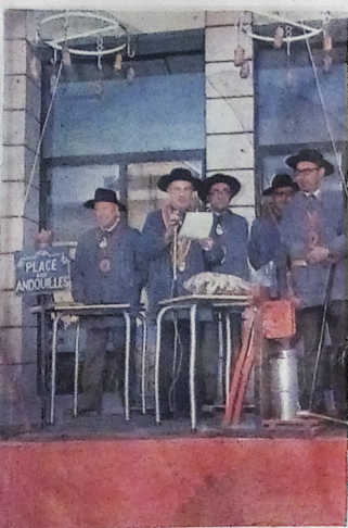
C'est aujourd'hui jour de fête au Val-d'Ajol, avec la traditionnelle Foire aux Andouilles. Journée des affaires et de la bonne humeur, ce lundi verra nombre d'amateurs et de curieux roller la cité ajolaise.