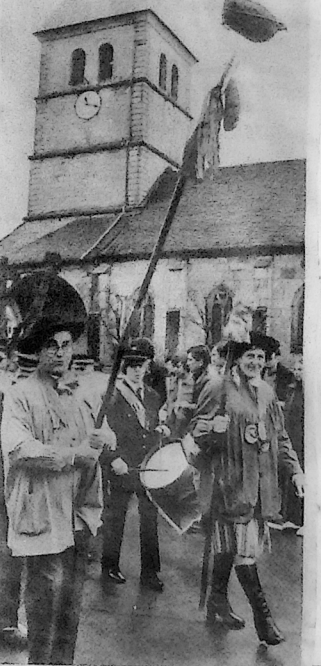
Les andouilles toujours en tête