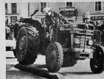
et leur technique !