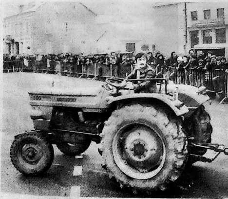
Les meilleurs conducteurs de tracteurs s'affrontent