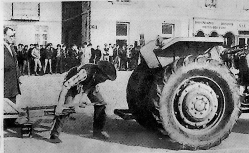
Admirez la rapidité des cow-boys...