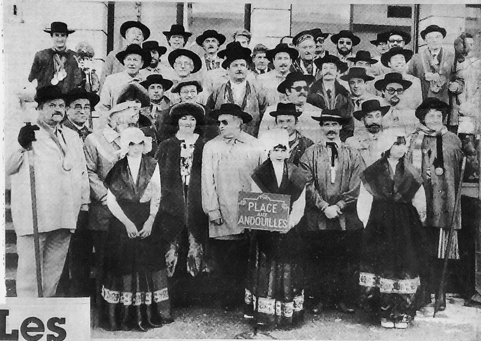
Les nouveaux intronisés sur la place rebaptisée pour la circonstance.